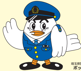
埼玉県警察マスコット ポッポくん