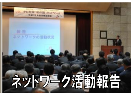
ネットワーク活動報告