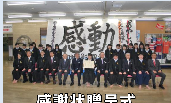
書道パフォーマンス実演