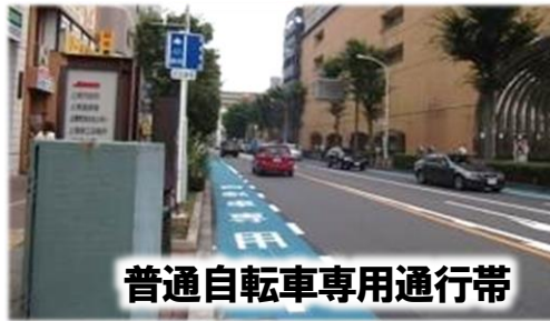
普通自転車専用通行帯