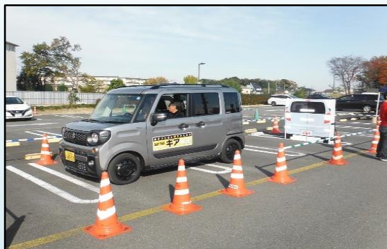
【安全運転サポート車】