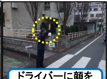
ドライバーに顔を 向け意思表示