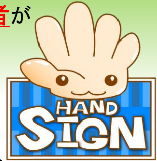
イメージキャラクター 「SIGN(サイン)ちゃん」