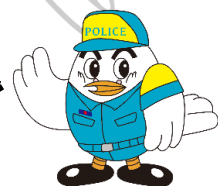
埼玉県警察マスコット ポツポくん

自宅で地震が発生した場合、あなたの家庭は安全ですか？ 家の耐震化や家具固定などの対策を行い、自宅の安全環境づくりを 行いましょう。