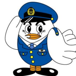
Mascot ng Saitama Police Poppo-Kun

Bilang pamilya, i-check ninyo ang mga gamit na mayroon kayo sa bahay at ihanda ninyo ang mga gamit na kakailanganin ninyo sa oras ng kalamidad.