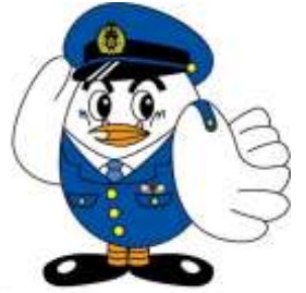
埼玉県警察シンボルマスコット ポッポくん