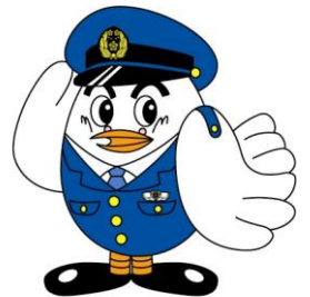
埼玉県警察シンボルマスコット ポッポくん