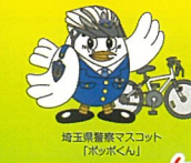
埼玉県警察マスコット「ポッコくん」