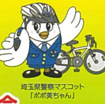
埼玉県警察マスコット「ポッコくん」