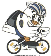
埼玉県警察マスコット「ポッコくん」

埼玉県警察では、自転車指導啓発重点地区・路線において、重点的・計画的に自転車通行空間の整備、啓発活動及び指導取締りを推進しています。