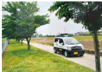
青色回転灯等装備車によるパトロール活動

県内では、令和7年12月末現在、722台が活動し、登下校の見守り活動等を実施しており、青色防犯パトロールに必要な情報の提供や実施方法の指導等の支援を行っています。