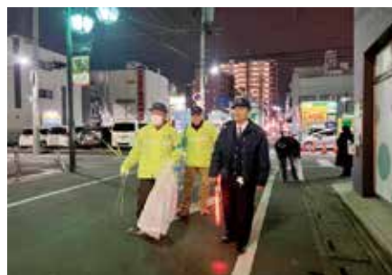
自主防犯活動団体によるパトロール

県警察では、これらの団体に対し、犯罪の発生状況や防犯情報を提供しているほか、警察官との合同パトロールや、研修会の開催、活動マニュアルの整備等の支援を行っています。