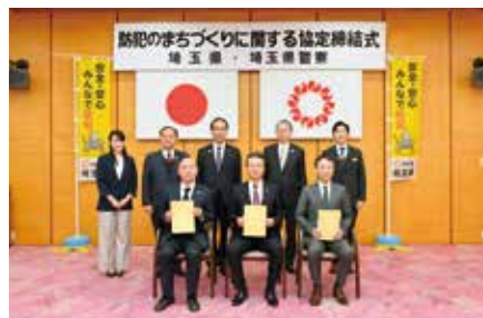
県、県警察、事業者等による協定の締結

安全・安心な地域社会の実現に向け、県内で活動する事業者、団体等と「不審者を目撃した場合の通報、保護を必要とする子供・高齢者の救護、防犯に関する広報啓発活動への協力、特殊詐欺等の犯罪被害者を把握した場合の声かけ」等を内容とする地域安全協定を積極的に締結しています。