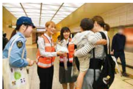
ヤング防犯ボランティア「クリッパーズ」の広報啓発活動

若い世代の自主防犯活動への参加促進を図り、将来における自主防犯活動の一層の活性化と定着化を促進することを目的に、県内に通学・勤務又は居住する若者を埼玉県警察ヤング防犯ボランティア「クリッパーズ」のメンバーとして委嘱し、各種防犯ボランティア活動への積極的な参加を呼びかけています。