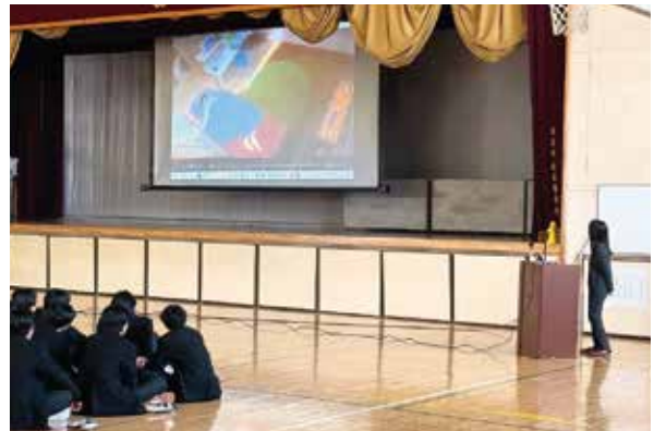
命の大切さを学ぶ教室の開催状況

犯罪被害者支援室では、社会全体で被害者を支え、被害者も加害者も出さない街づくりの気運の醸成を図る施策の一環として、犯罪被害者遺族等による「命の大切さを学ぶ教室(小・中・高校生対象)」及び「犯罪被害者支援講義(大学・専門学校生対象)」を行っています。