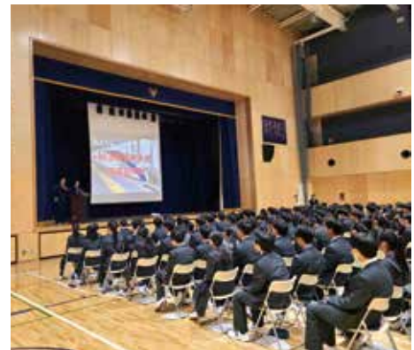
痴漢犯罪防止講話

◆各指導班の派遣及び講習会等のお申し込み方法の詳細は、県警ホームページをご覧ください。 https://www.police.pref.saitama.lg.jp/