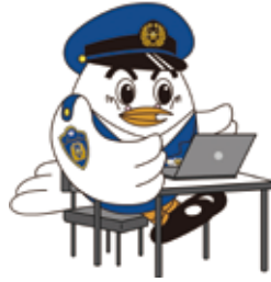
サイバーセキュリティ講演

サイバー対策課では、年々悪質化・巧妙化するサイバー犯罪に巻き込まれないようにするため、県内の学校や事業者を対象とした講演を行っています。