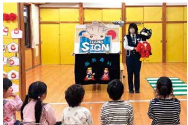
交通安全教育指導班「ふれあい」の活動状況

交通安全教育指導班「ふれあい」は、県内の幼稚園、学校、企業、自治会等において、交通事故抑止を図るための交通安全教育を行っています。交通安全教育では、警察官等が腹話術や各種資機材を活用しながら、交通事故の発生状況や事故防止について対象に応じて分かりやすく説明しています。