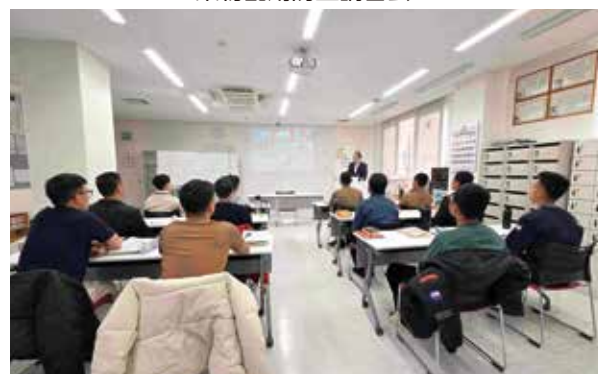
薬物乱用防止講習会

心身の健康を損ない、様々な凶悪事件、重大事故を引き起こす薬物乱用の恐ろしさを伝え、その根絶を目指しています。