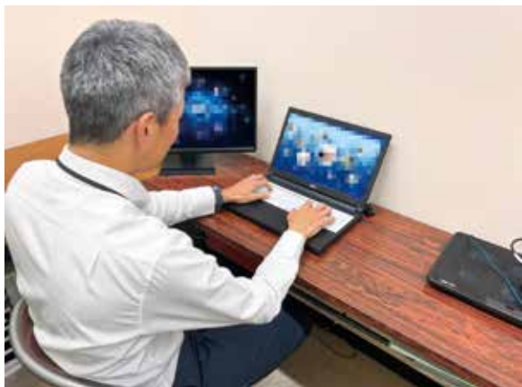
捜査資器材の充実による事件分析の強化