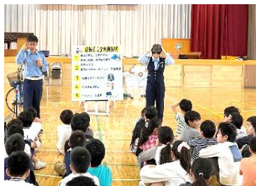
外国人の子どもに対する 効果的な交通安全教室