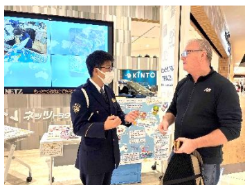
外国人に対するイベント 交通ルール等の説明