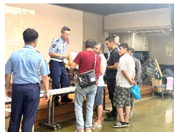
外国人向け 交通安全体験フェア