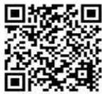
自転車への 青切符の導入 埼玉県警HP