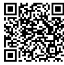
交通安全 eラーニング 埼玉県警HP