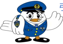
埼玉県警察マスコット 「ポッポくん」

□自転車の基本的な交通ルールに変更はありません。 □これまで「赤切符」で検挙されていた交通違反の一部が、「青切符」で検挙されることとなります。 その場で反則金の納付書が交付されます。