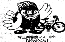
埼玉県警察マスコット「ポッポくん」