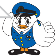
埼玉県警察 マスコットキャラクター「ポッポくん」

みんなできたかな? おうちの人とやってみてね。くわしいないようはうらめんをかくにんしよう!