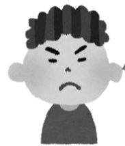
がっこうのせんぱい 学校の先輩

おい!俺のバイト手伝えよ! 電話するだけのバイトで、お前にも 分け前やるからいいだろ?