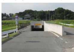
・アンダーパス南側出入口