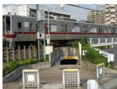
・地下道西側出入口