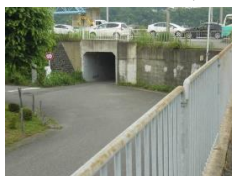
・アンダーパス西側出入口