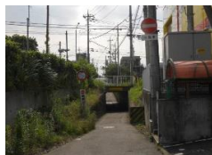
・アンダーパス東側出入口