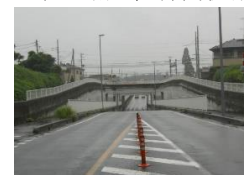
・アンダーパス南側出入口