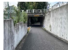
・アンダーパス南側出入口