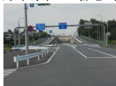
・アンダーパス南側出入口