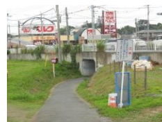
・アンダーパス東側出入口