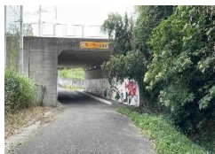
・アンダーパス北側出入口