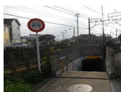
・地下道東側出入口