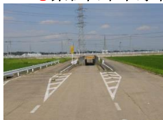
・アンダーパス西側出入口