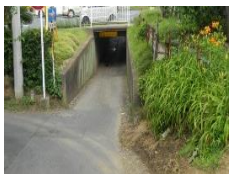
・アンダーパス西側出入口