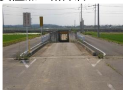
・アンダーパス東側出入口