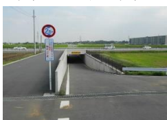
・アンダーパス北側出入口