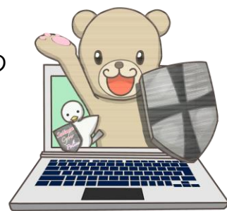
埼玉県警察サイバー局公認キャラクター Cybear