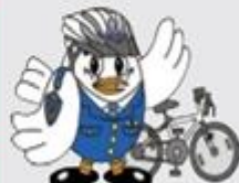
埼玉県警察マスコット 「ポッコくん」