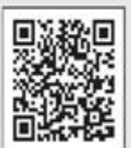
交通安全eラーニング 埼玉県警察ホームページ