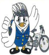
埼玉県警察マスコット「ポッポくん」

青切符の導入により、検挙後の手続きは大きく変わります。しかし、自転車の基本的な交通ルールや交通違反の指導取締りについての考え方は変わりません。