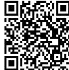
交通安全eラーニング 埼玉県警HP