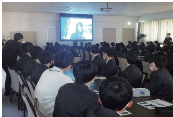
痴漢犯罪防止動画視聴会の様子

◆各指導班の派遣及び講習会等のお申し込み方法の詳細は、 県警ホームページをご覧ください。 https://www.police.pref.saitama.lg.jp/