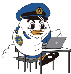
サイバーセキュリティ講演

サイバー対策課では、年々悪質化・巧妙化するサイバー犯罪に巻き込まれないようにするため、県内の学校や事業者等を対象とした講演を行っています。