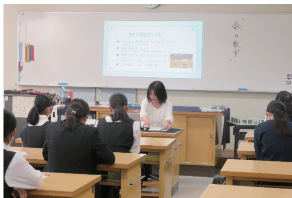
命の大切さを学ぶ教室の開催状況

犯罪被害者支援室では、社会全体で被害者を支え、被害者も加害者も出さない街づくりの気運の醸成を図る施策の一環として、犯罪被害者遺族等による「命の大切さを学ぶ教室(小・中・高校生対象)」及び「犯罪被害者支援講義(大学・専門学校生対象)」を行っています。