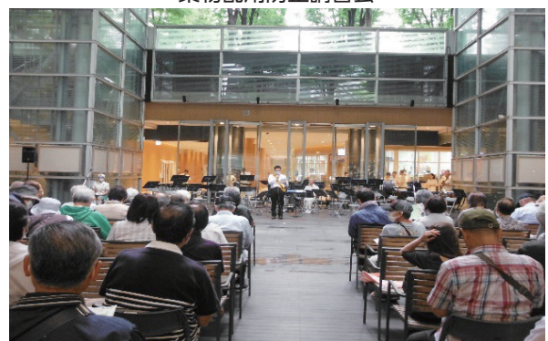
薬物乱用防止講習会

心身の健康を損ない、様々な凶悪事件、重大事故を引き起こす薬物乱用の恐ろしさを伝え、その根絶を目指しています。