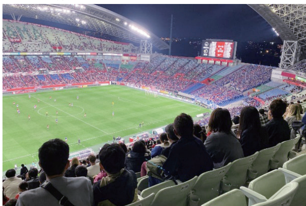
浦和レッドダイヤモンズとの共同事業