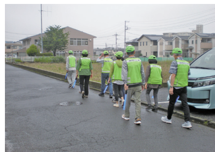
自主防犯活動団体によるパトロール

県警察では、これらの団体に対し、犯罪の発生状況や防犯情報を提供しているほか、警察官との合同パトロールや、研修会の開催、活動マニュアルの整備等の支援を行っています。