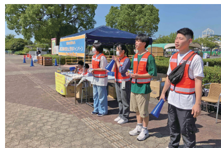
ヤング防犯ボランティア「クリッパーズ」の広報啓発活動

若い世代の自主防犯活動への参加促進を図り、将来における自主防犯活動の一層の活性化と定着化を促進することを目的に、県内に通学・勤務又は居住する若者をヤング防犯ボランティア「クリッパーズ」のメンバーとして委嘱し、各種防犯ボランティア活動への積極的な参加を呼びかけています。