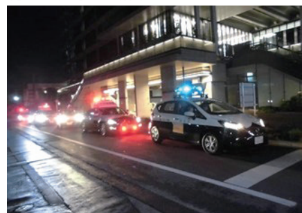
青色回転灯等装備車によるパトロール活動

県内では、令和5年12月末現在、777台が活動し、登下校の見守り活動等を実施しており、青色防犯パトロールに必要な情報の提供や事案対応の指導等の支援を行っています。