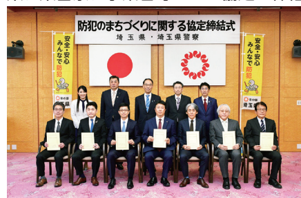
県、県警察、事業者等による協定の締結

県民生活の安全を確保するため、地域を巡回する事業者、団体等と「不審者を目撃した場合の通報、保護を必要とする子供・高齢者の救護、防犯に関する広報啓発活動への協力、特殊詐欺等の犯罪被害者を把握した場合の声かけ」等を内容とする地域安全協定を積極的に締結しています。