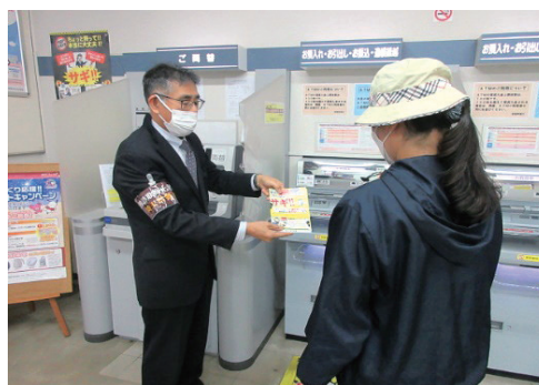
特殊詐欺抑止対策員の活動状況(イメージ)