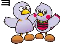
埼玉県マスコット