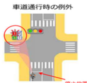
「歩行者・自転車専用」の標示があるときは、「歩行者用信号」に従い、停止線で止まる