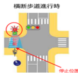
「歩行者用信号」に従い、交差点の直前で止まる