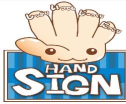
道路横断時の安全行動イメージキャラクターサイン(SIGN)ちゃん

新入生は初めての登下校ですので、特に交通事故に注意してください。上級生も今一度交通ルールを確認し、安全に登下校しましょう。