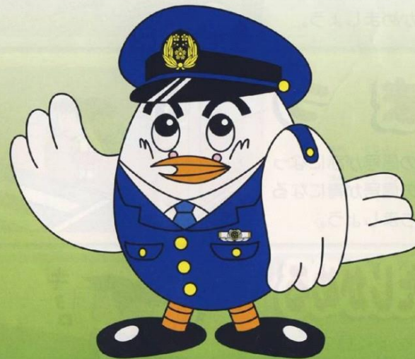
埼玉縣警察吉祥物「玻玻」