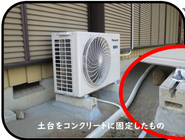
滑川町 山田自治会