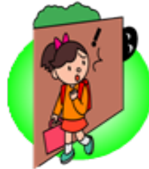
1.ひとりにならない