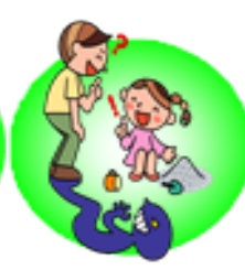
2.知らない人についていかない