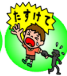
3.大きな声でたすけをよぶ