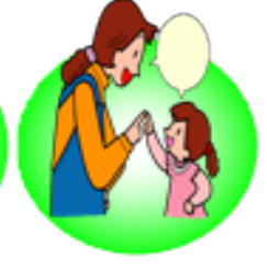
4.だれとどこで何時まで遊ぶか家の人に話す