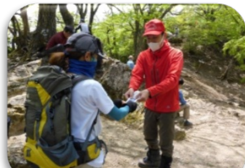
伊豆ヶ岳における山岳パトロール