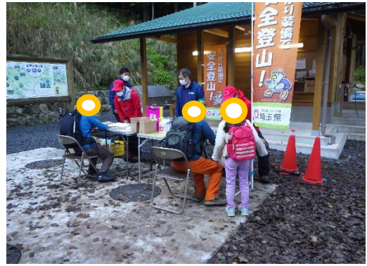
武甲山・一ノ鳥居の状況