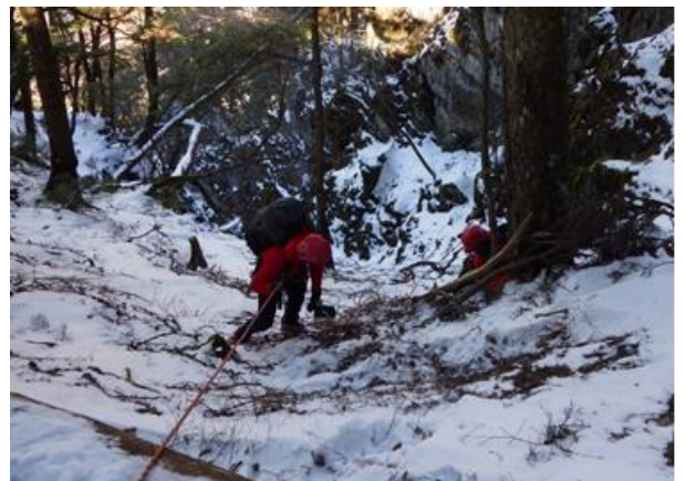
12月17日 雲取山(芋ノ木ドツケ) 遭難者を捜索している状況