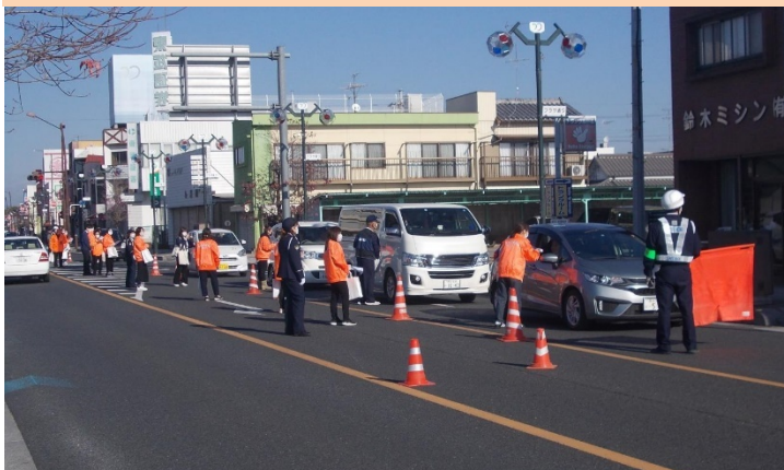
セブンイレブン羽生中央三丁目店前路上 「母の会レター作戦」の実施状況（12月7日）

中でも、市内11校の小学5年生が交通安全を願う気持ちを綴った手紙を、通行中のドライバーに手渡す「母の会レター作戦」が羽生市交通安全母の会御指導の下に実施され、大きな反響がありました。また、警察では歩行者保護のため、市内11校の小中学校児童に対する通学路警戒国道122号や南部環状線等の主要交差点における薄暮時間帯の交差点監視を実施しました。