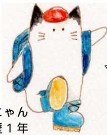
スピにゃん 登山歴1年