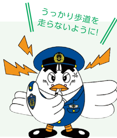
埼玉県警察マスコット「ポッポくん」