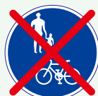
自転車歩道通行可