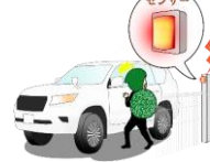
防犯システム 警報機 センサーライト等