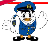
埼玉県警察マスコット 「ポッポくん」