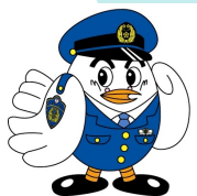
県警マスコット ポッポくん