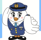
県警マスコット ポポ美ちゃん