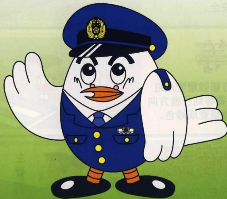
埼玉縣警察吉祥物「玻玻」