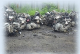
tách biệt và bảo quản động cơ