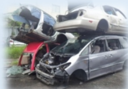
bảo quản và tháo rời xe ô tô