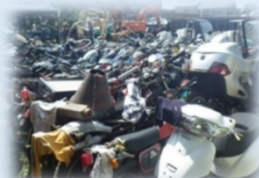
bảo quản và tháo rời xe máy