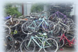
bảo quản và tháo rời xe đạp