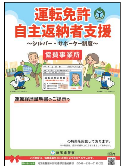
協賛事業所ポスター・ステッカー