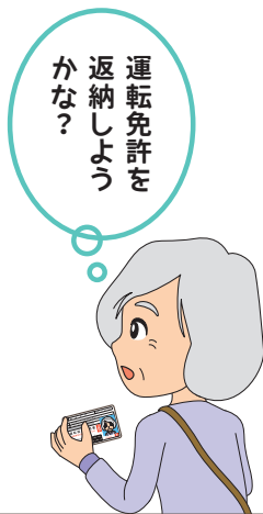
協賛事業所ポスター・ステッカー 運転免許自主返納ロゴマーク