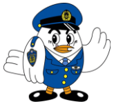
埼玉県警察マスコット「ポッコくん」