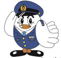
県警マスコットポッコくん

先日、青パトと対向から来た一般車両がすれ違う際に、ミラー同士を接触させる交通事故が発生しました。今回は青色防犯パトロール中に交通事故を起こした際の対処方法についてお知らせします。