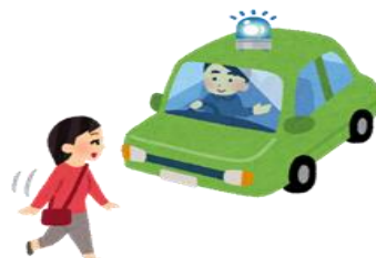
ゆとりを持った運転

青パトは、周りの注目を集めます。交通ルールを守り、安全運転をしていただくようお願いいたします。