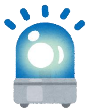
青色回転灯は必ず点灯