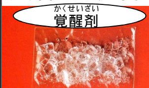
かくせいざい 覚醒剤